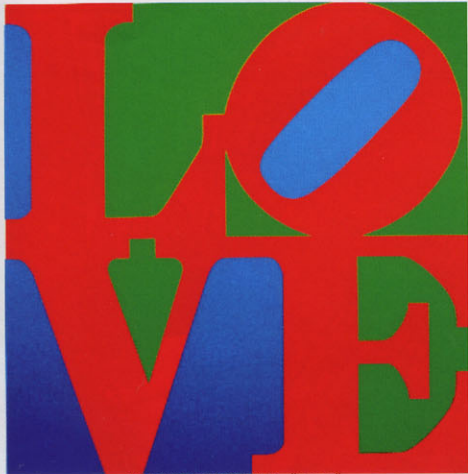
ROBERT INDIANA "Love"