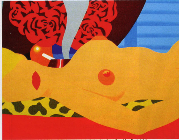
TOM WESSELMANN- "Nude for Sedfre" 1969