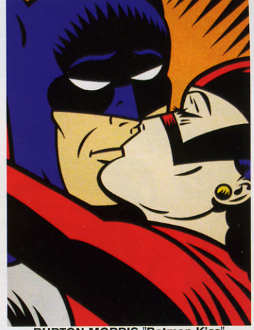
BURTON MORRIS "Batman Kiss"